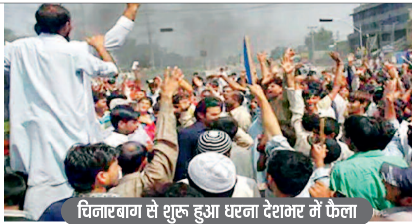
चिनारबाग से शुरू हुआ धरना देशभर में फैला

पाकिस्तान के कब्जे वाले गिलगित-बाल्टिस्तान में एक बार फिर सियासी उबाल देखने को मिल रहा है। कार्यवाहक सरकार के मंत्रिमंडल गठन को लेकर युवा कार्यकर्ता (जेन-जेड), विपक्षी दल और आम लोगों ने विरोध-प्रदर्शन शुरू कर दिया है।