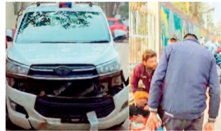
जहां उनका इलाज जारी है। पुलिस ने मौके पर पहुंचकर घटना की जांच शुरू कर दी है।